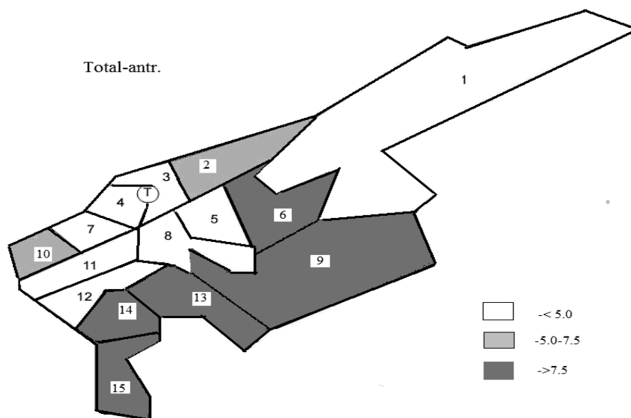
Рис. 1. Распределение условного показателя общей загрязненности:

1 – Бостанлыкский, 2 – Кибрайский, 3 – Ташкентский, 4 – Зангиотинский, 5 – Верхнечирчикский, 6 – Паркентский, 7 – Янгиольский, 8 – Среднечирчикский, 9 – Ахангаранский, 10 – Чиназский, 11 – Нижнечирчикский, 12 – Аккурганский, 13 – Пскентский, 14 – Букинский, 15 – Бекабадский, Т – Ташкент